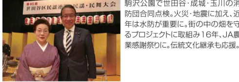
おちたかお @ochitakao の眩き 様々なイベントを開催する皆さまに心から敬意を表します。